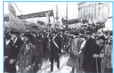
Борьба за всеобщее избирательное право. Демонстрация в Вене 22 ноября 1905 г. под лозунгом «Даёшь всеобщее избирательное право!»

Консерваторы , опиравшиеся на земельную аристократию и крестьянство, выступали под лозунгом сохранения традиций и порядка, а либералы , отражавшие интересы буржуазии городов, отстаивали идеи свободы и равенства (равенства как демократии и снятия ограничений, но не как уравнительности). Главный вектор политической борьбы проходил по линиям консерваторы — либералы, монархисты — республиканцы.