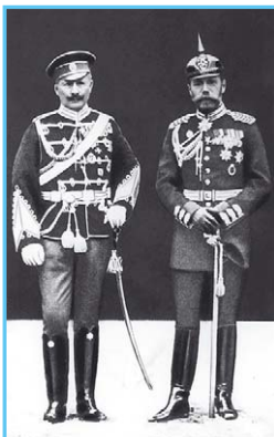
Вильгельм II и Николай II

Россия пошли на заключение франко-русского союза и подписали военно-политическую конвенцию (1891—1893). Таким образом, в