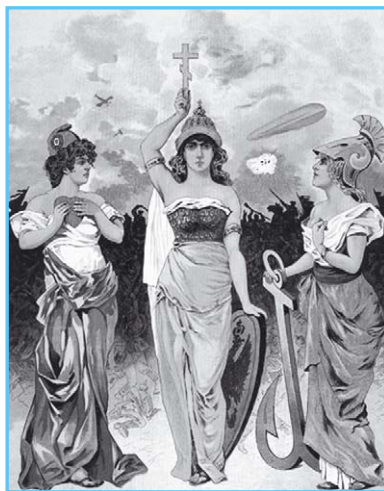
Антанта. Российский плакат. 1914 г.

В конечном итоге к Антанте присоединилась и Россия. Англия постаралась уладить отношения с Россией, которая, в свою очередь, стремилась к сближению с Великобританией после поражения в Русско-японской войне. В результате подписания англо-русской конвенции в 1907 г. о размежевании сфер влияния в Иране, Афганистане и Тибете завершилось формирование Антанты в составе Англии, Франции и России . Так окончательно оформился раскол Европы на два противостоящих друг другу блока великих держав, который привёл мир к невиданной ранее войне.