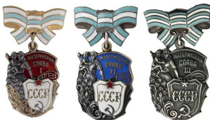
Ордена Материнской славы