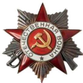
Ордена «Отечественной войны» 1 и 2 степени