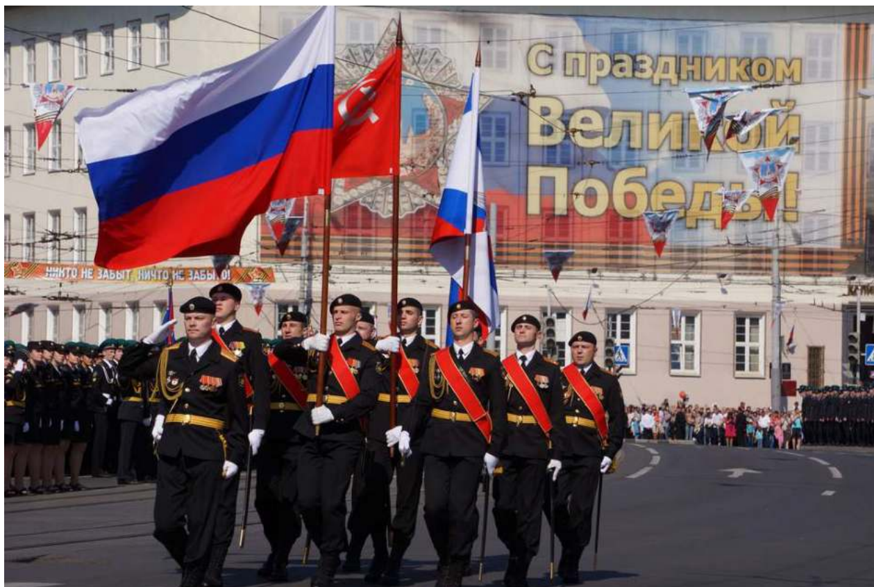
Военный парад в честь 9 мая г. Калининград