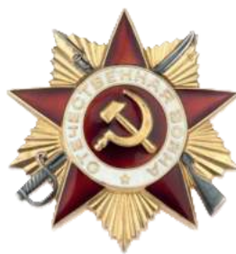
Орден «Красная Звезда» Ордена «Отечественной войны» 1 и 2 степени