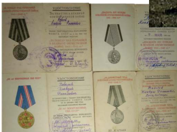
За доблесть и отвагу.